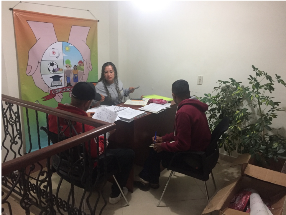
Reunion Planeación - Junta Directiva