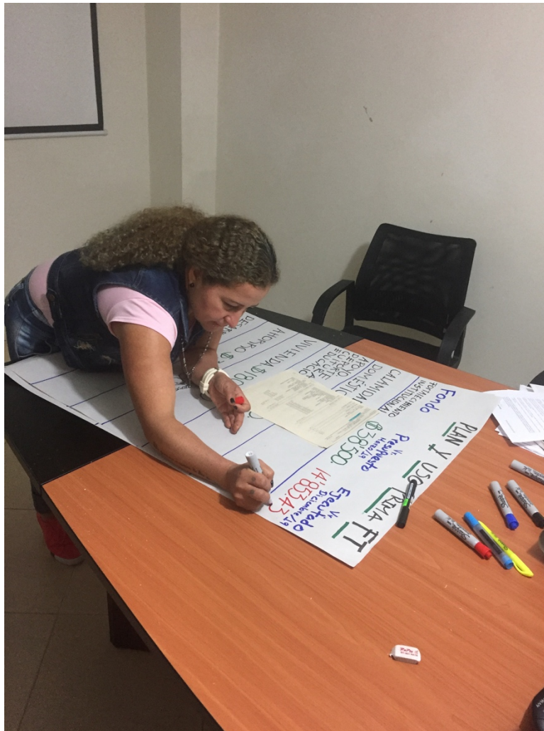
Preparación de Informe para Asambleas Zonales 2020

Resumiendo se logró poner a funcionar nuestra Corporación con un plan anual de trabajo con una contabilidad organizada y el acompañamiento de Agrojar SAS en los diferentes procesos