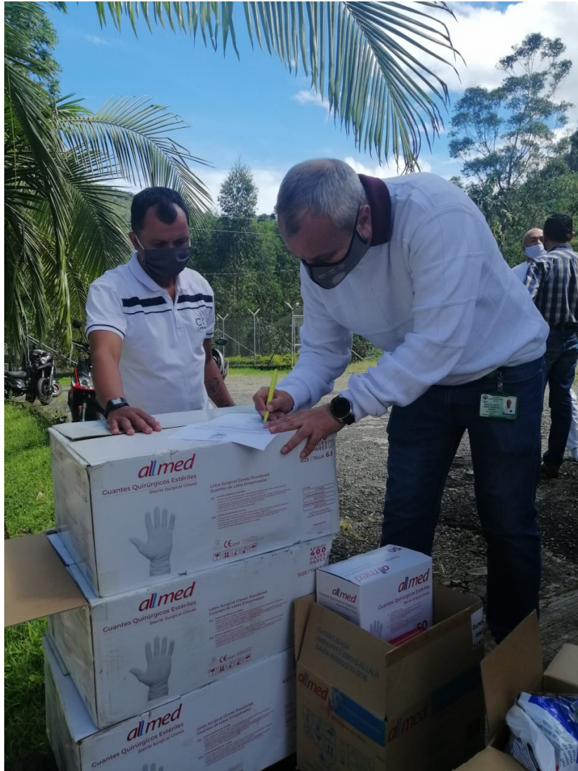
Entrega de Insumos Medicos en el Hospital Municipal de Jardin (Antioquia)

A parte de la visita de los asesores, también se logro tener reuniones con los alcaldes de Jericó y Jardín para socializar nuestro interés sobre avanzar en un proyecto de vivienda lo mas pronto posible y, por ende, unir esfuerzos. Aunque no se logró cristalizar ningun proyecto de vivienda nueva o mejoramiento de alguna, consideramos que estamos encaminados a lograr este sueño para una gran parte de los corporados.