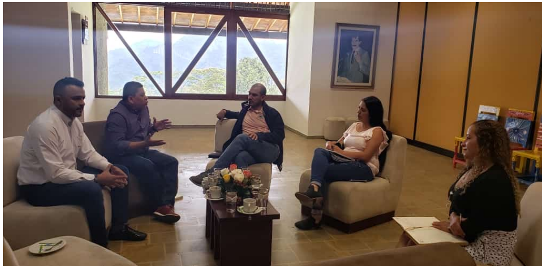
Reunión con directivos de Comfenalco

de aliados como Comfenalco y las alcaldías locales ya que los recursos económicos definidos no eran suficientes. También se realizó la búsqueda de lotes para construcción, pero se observó que eran predios costosos. Al cierre del 2019, no se ejecutó ningún recurso económico, pero se lograron importantes acercamientos con las entidades mencionadas pensando en comenzar una adecuada ejecución de los recursos en el 2020.