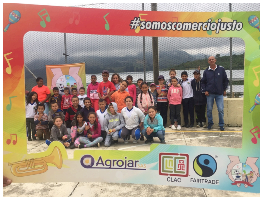
Niños y Niñas beneficiarios de la Escuela Vereda Serranías