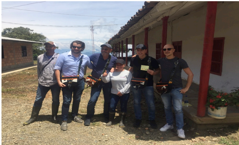
Encuentro con compradores internacionales de la fruta Fairtrade

En resumen, hoy por hoy, nuestra Corporación goza de mayor reconocimiento y visibilidad, gracias a la posibilidad de participar activamente en la CLAC y gracias al apoyo que nos está brindando Agrojar SAS al permitirnos asistir a todas estas invitaciones, así como ayudándonos con otros contactos. Es importante destacar que la empresa, cuando es una actividad pertinente para la Corporación, nos facilita todos los permisos laborales remunerados y nos ayudan con las gestiones que se necesiten para hacer estos eventos y reuniones.