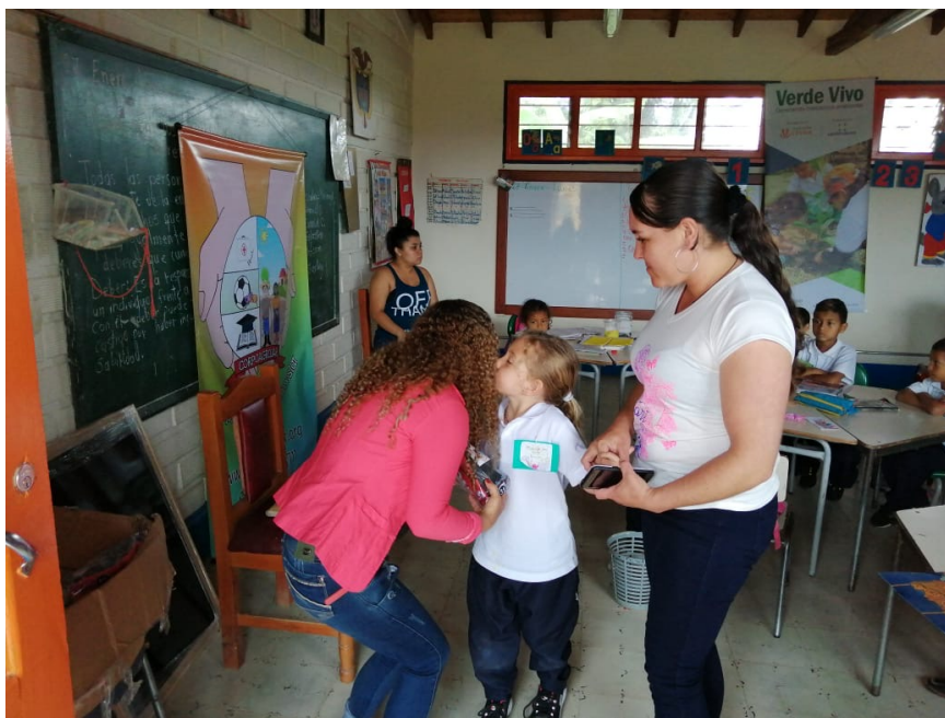
Beneficiaria de la Escuela Vereda Castalia