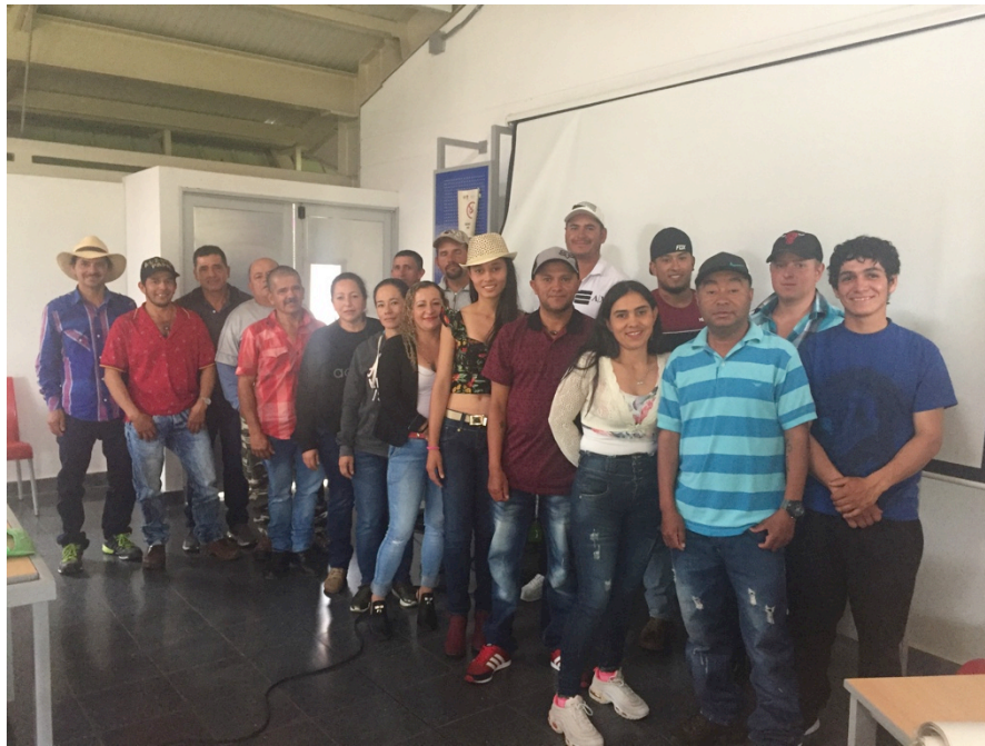
Delegados Asamblea General 2019

Para el caso del uso de la Prima Fairtrade, se crearon los siguientes fondos: