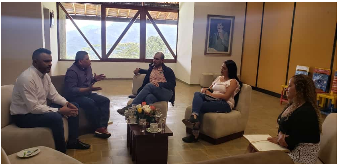
Reunion con directivos de Comfenalco

En resumen y considerando que tradicionalmente hemos sido trabajadores agricolas con poca experiencia en el manejo de proyectos, podemos decir que avanzamos acertadamente en la implementación de los fondos