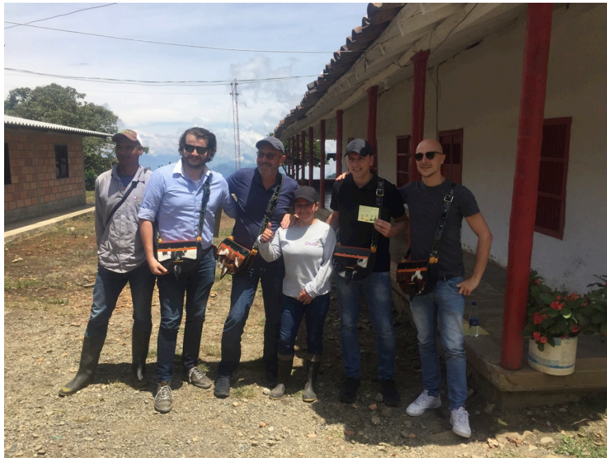
Encuentro con compradores internacionales de la fruta Fairtrade

En resumen, hoy por hoy, nuestra Corporación goza de mayor reconocimiento y visibilización gracias a la posibilidad de participar activamente en la CLAC y gracias al apoyo que nos está brindando Agrojar SAS al permitirnos asistir a todas estas invitaciones así como ayudándonos con otros contactos. Es importante destacar que la empresa, cuando es una actividad pertinente para la Corporación, nos facilita todos los permisos laborales remunerados y nos ayudan con las gestiones que se necesiten para hacer estos eventos y reuniones.