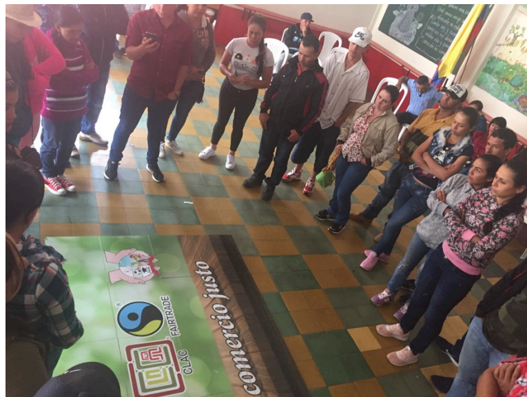
Celebración Día Internacional del Comercio Justo