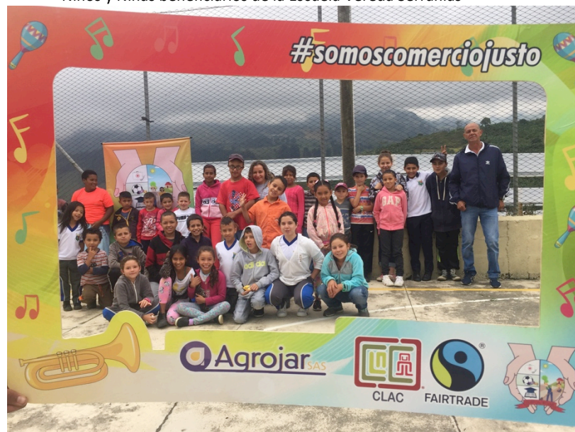
Niños y Niñas beneficiarios de la Escuela Vereda Serranías